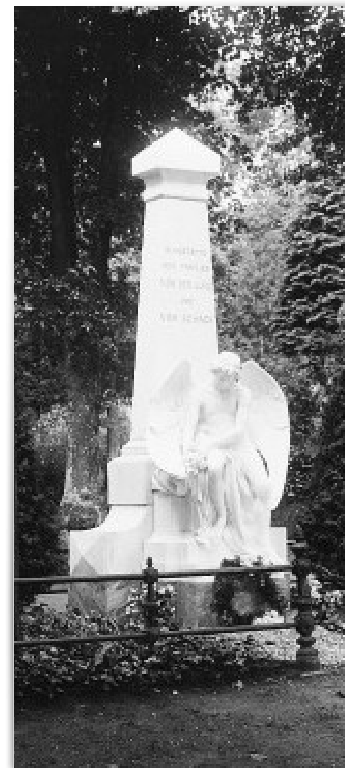
Grabstätte der Familien von Schack und von der Lühe um 1910.